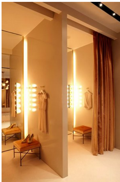
Este provador tem uma iluminação perfeita.