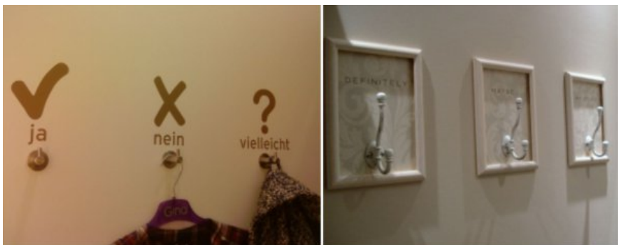
Ganchos a dizer, sim , talvez, não

Para além disso, terá que ter cabides ou ganchos para as pessoas colocarem a roupa. Uma solução interessante é ter dois ganchos, num está escrito: “sim, levo”, no outro “não”, poderá ter um terceiro a dizer: “talvez”.