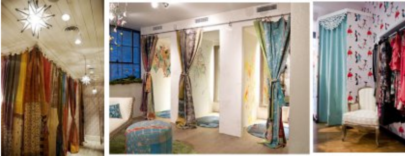
Ideias de cortinados originais e femininos

Provadores – Como criar provadores de lojas de roupa que fazem os clientes comprar