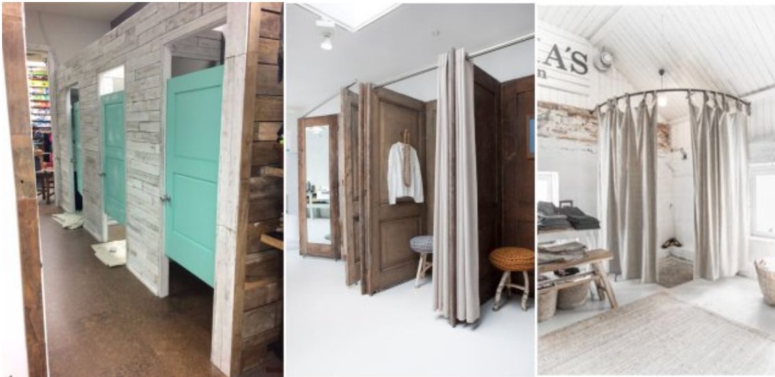
Fig.1 - Paredes pladur e portas, fig.2 - placas (portas) a separar e cortinado, fig.3 - cortinado em varão.

Caso opte pelo sistema mais simples, que é o varão com cortinado, certifique-se que o sistema está bem fixo à parede, porque as pessoas poderão fazer força nos cortinados.