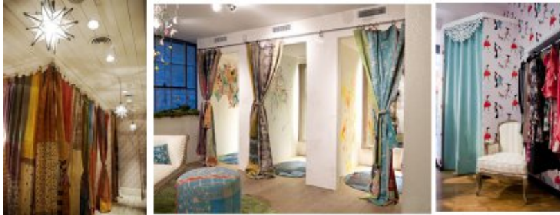
Ideias de cortinados originais e femininos

Nota: Em anexo existem ficheiros com desenhos de mandalas para colocar no chão. Você pode mandar recortar os desenhos, em vinil autocolante, utilizando estes desenhos prontos a utilizar.