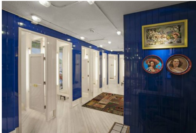
Espaço próprio para provadores, separado do resto da loja

Nas lojas grandes (+ de 200 m 2 ) deve ser criado um espaço à parte para os provadores, com o objetivo de ser mais fácil o controle dos clientes e as filas para provar a roupa.