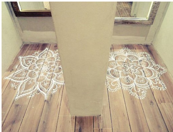
Este pavimento é muito atraente

Uma cliente que veja estes desenhos antes de experimentar a roupa, vai ficar mais bem disposta e impressionada com a atenção que a sua loja dá aos detalhes.